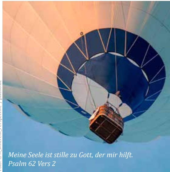
Meine Seele ist stille zu Gott, der mir hilft. Psalm 62 Vers 2